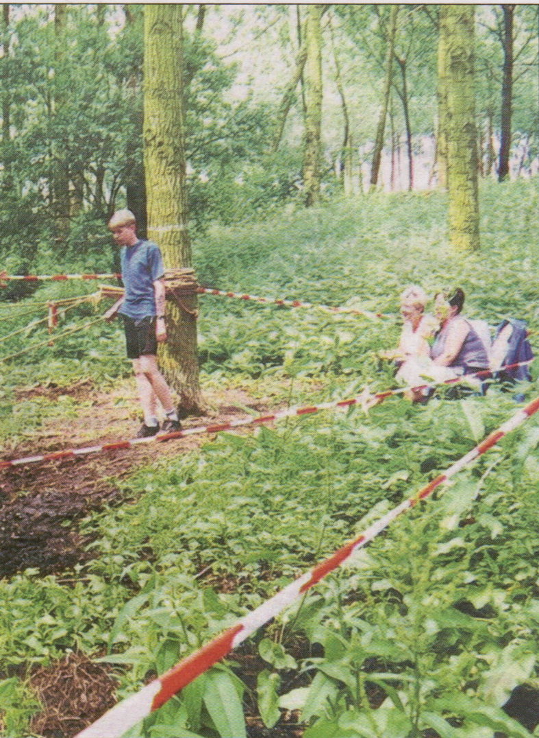
Een van de eerste afleveringen van de Survivalrun in Boven-Leeuwen. Het Groenewoud was nog een wildernis.

DSZ organiseren het evenement nu al voor de zestiende keer. Om geld in de clubkassen te krijgen én om leven in de brouwerij te krijgen.